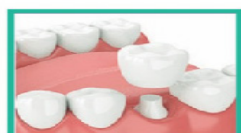
Single Tooth Dental Implant

Fellow International Congress Oral Implantologists