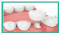
Single Tooth Dental Implant

Có trên 15 năm kinh nghiệm Fellow International Congress Oral Implantologists