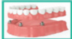
Implant- Supported Denture