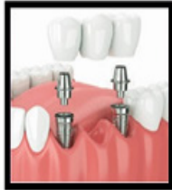
Implant- Supported Bridge

(Có gây mê tại văn phòng) (Oral & Intravenous Sedation)