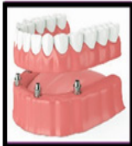
Implant- Supported Denture