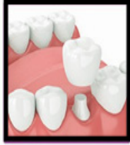
Single Tooth Dental Implant

1600 N PLANO RD #2200 RICHARDSON, TX 75081