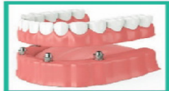
Implant- Supported Denture