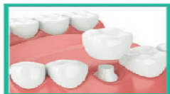
Single Tooth Dental Implant

Fellow International Congress Oral Implantologists